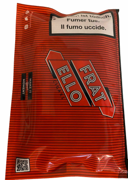
Fratello Camo Robusto Sampler