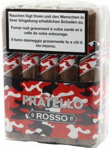
Fratello Camo Rosso Robusto