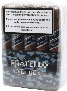
Fratello Camo Blue Robusto

Mit der Camouflage Linie präsentiert Omar de Frias preiswerte Longfiller-Zigarren welche in drei Sorten bei «La Aurora» in der Dom. Rep. von Hand gefertigt werden. Der dominikanische und indonesische Tabak für die Einlage wird umhüllt von einem Umblatt aus Indonesien. Die drei im sehr beliebten Robusto Format erhältlichen Blends unterscheiden sich in der Aromatik nicht nur aufgrund ihrer verschiedenen Deckblätter; diese beschreiben die Varianten in der geschmacklichen Charakteristik jedoch sehr gut.