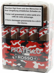
Fratello Camo Rosso Robusto