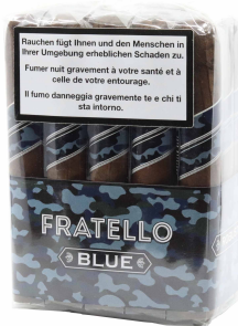
Fratello Camo Blue Toro