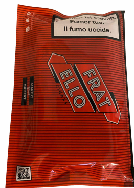
Fratello Camo Robusto Sampler