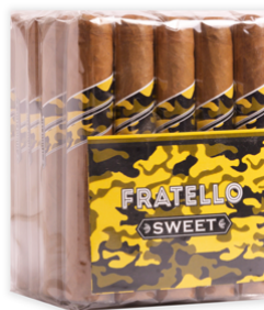
Fratello Camo Sweet Toro