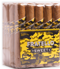
Fratello Camo Sweet Robusto