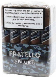
Fratello Camo Blue Robusto

Mit der Camouflage Linie präsentiert Omar de Frias preiswerte Longfiller-Zigarren welche in drei Sorten bei «La Aurora» in der Dom. Rep. von Hand gefertigt werden. Der dominikanische und indonesische Tabak für die Einlage wird umhüllt von einem Umblatt aus Indonesien. Die drei im sehr beliebten Robusto Format erhältlichen Blends unterscheiden sich in der Aromatik nicht nur aufgrund ihrer verschiedenen Deckblätter; diese beschreiben die Varianten in der geschmacklichen Charakteristik jedoch sehr gut.