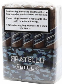
Fratello Camo Blue Toro