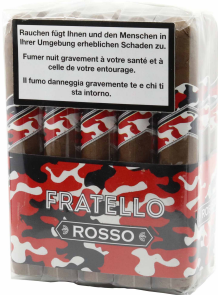
Fratello Camo Rosso Robusto